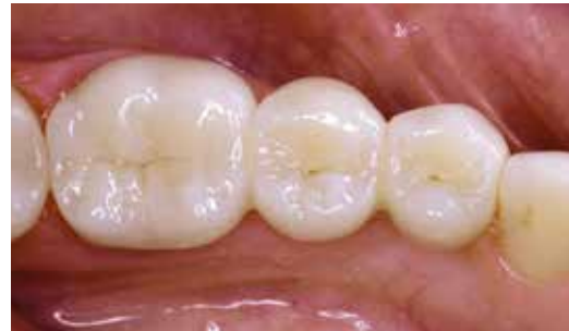
Potem: Uzupełnienie brakującego zęba za pomocą mostu pełnoceramicznego.