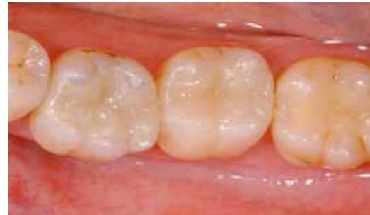
Potem: Wypełnienia w kolorze zęba wykonane z materiału pełnoceramicznego