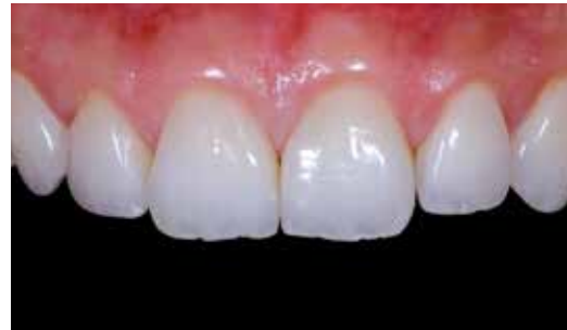
Potem: Przerwy zamknięte licówkami pełnoceramicznymi