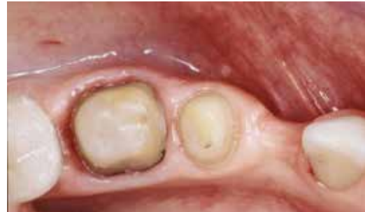
Przedtem: Brakujący ząb i próchnica sąsiednich zębów