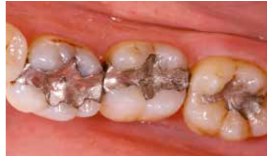
Przedtem: Ciemne wypełnienia z amalgamatu