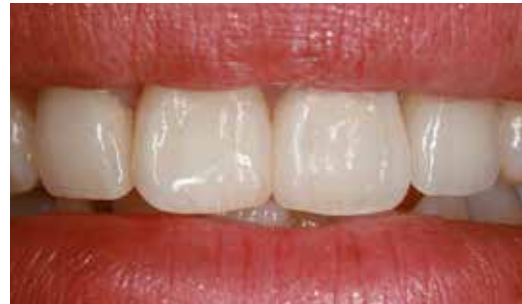
Potem: Korony pełnoceramiczne na naturalnym kikucie zęba (po lewej) i na implancie (po prawej)