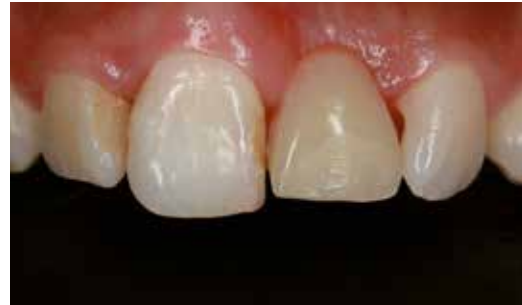
Przedtem: Uszkodzony siekacz (po prawej) i siekacz zastąpiony implantem (po lewej).